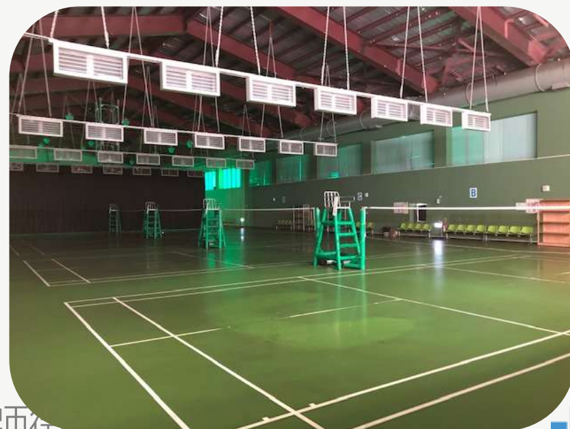
羽球場 排球場 籃球場