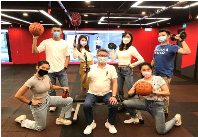
榮獲 2021 HR Asia 「亞洲最佳企業雇主獎」