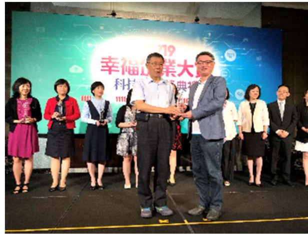
獲人力銀行票選 「科技業幸福企業」