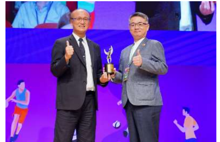
獲教育部體育署頒發 「運動企業認證」